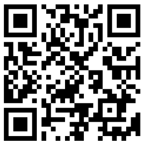
デジタルマルチメータ 使い方

回路でつまづいた時やわからないことがある時は、基本的な知識を見直しましょう。わからない時は、先輩や先生に相談して原因追求の手順を学びましょう。