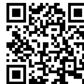
XH コネクタ圧着 取り付け方法